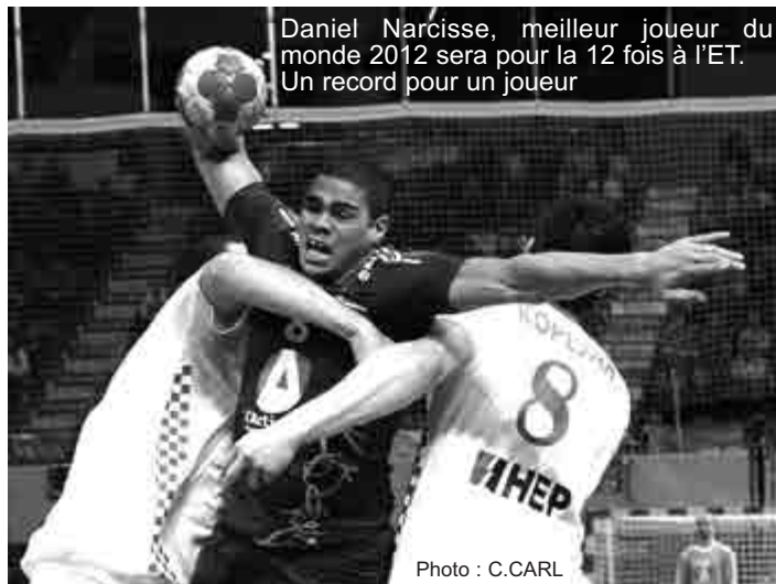
Daniel Narcisse, meilleur joueur du monde 2012 sera pour la 12 fois à l'ET. Un record pour un joueur

cette poule 2 sera le deuxième club qualifié pour la Champion's League français,