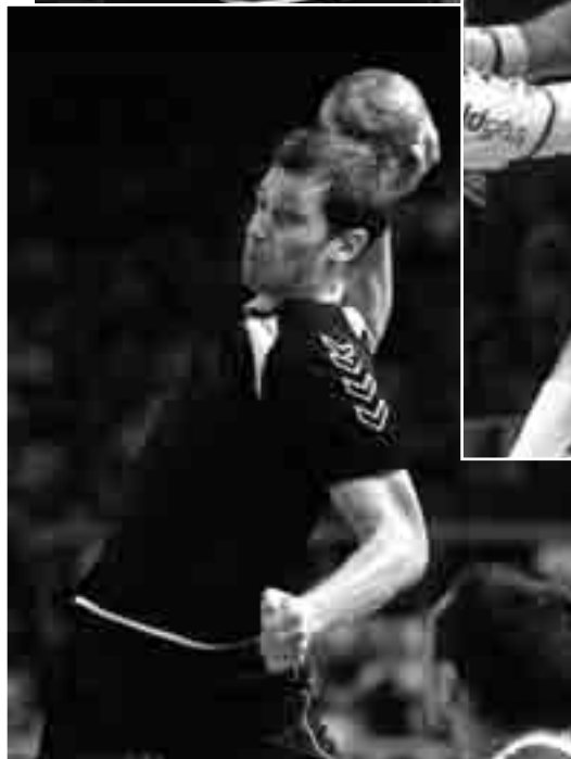
Les matchs d'hier