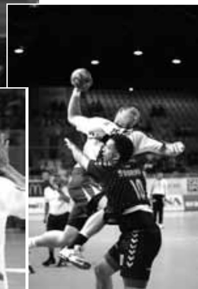
Les matchs d'hier