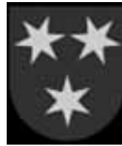
Armoiries de la ville de Celje et sa position sur la carte de Slovénie

Sigismund. Celje devint le centre administratif de la dynastie, et était le seul vrai centre humaniste et voué à la Renaissance de toute la Slovénie. Même après le combat opposant les Habsbourgs et les principautés avoisinantes,