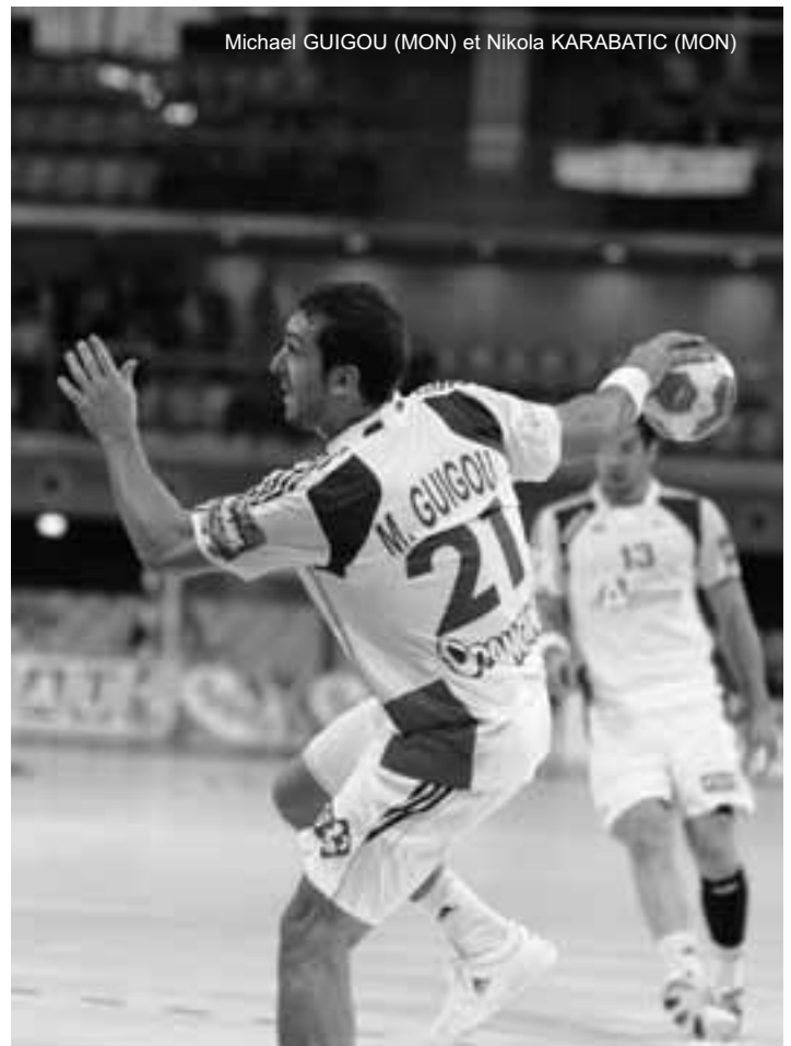
Michael GUIGOU (MON) et Nikola KARABATIC (MON)